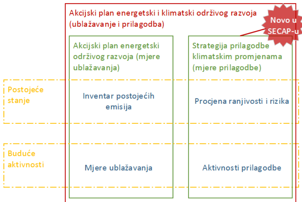
Slika 1: Prikaz sadržaja Akcijskog plana energetske i klimatske održive razvoja (tzv. SECAP-a)

Na slici je prikazana postojeća struktura i novosti koje donosi Akcijni plan energetske i klimatske održive razvoja grada u odnosu na dosadašnji Akcijni plan energetske održive razvoja grada. Postojeći Akcijni plan energetske održive razvoja sadržavao je samo mjere usmjerene k ublažavanju klimatskih promjena, odnosno smanjenju emisija CO 2 , dok Akcijni plan energetske i klimatske održive razvoja, uz mjere ublažavanja, sadrži i prijedlog konkretnih mjera prilagodbe klimatskim promjenama.